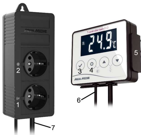
Fig. 1: T controller twin 2.0